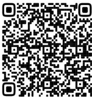
Рисунок 1. QR код для перехода на публикацию утвержденной ФОО НОО

В программе формирования УУД у обучающихся обосновано значение сформированных УУД для успешного обучения и развития младших школьников, приведена характеристика УУД. В качестве механизма конструирования образовательного процесса рассматривается интеграция предметных и метапредметных образовательных результатов. В программе показана роль каждого учебного предмета в становление и развитие УУД младшего школьника.