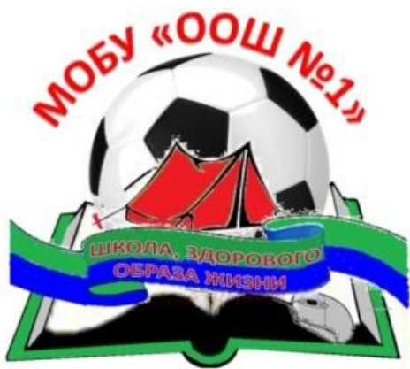
Рисунок 2. Эмблема школы

Традиции и ритуалы, символика, особые нормы этикета в образовательной организации: